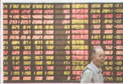
לוח מסחר אלקטרוני בשנחאי ביום 21 במאי 2018

עד עתה בחרו ענקיות הטכנולוגיה הסיניות לבצע הנפקות בבורסות מעבר לים, בגלל הרגולציה המכבידה • כעת מנסה סין לשנות את הכללים, ולאפשר למשקיעים המקומיים להחזיק תעודות שמגובות במניות של חברות ההייטק הסיניות • לא בטוח שזה יספיק